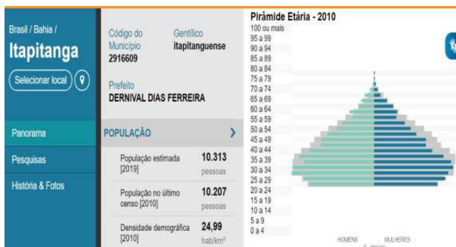
Tabela 01: População estimada do município de Itapitanga-Ba, ano 2019, por sexo e faixa etária.

https://cidades.ibge.gov.br/brasil/ba/itapitanga/panorama